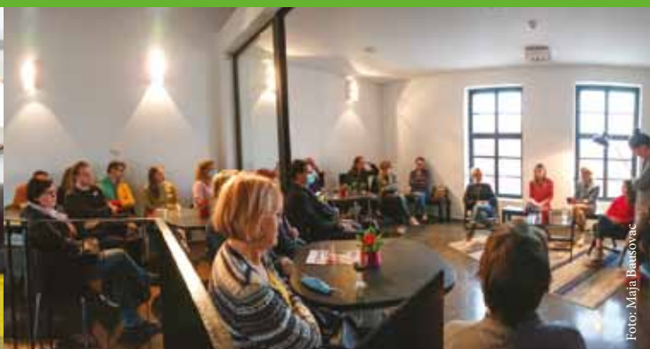
Dogajanje ob razstavi Ženske zgodbe smo zaključili s pripovedovalsko predstavo Isti zrak dihava.