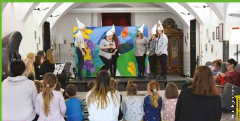
Partnerstvo traja že devet let! Predstavo za otroke celjskih vrtcev so izvedli dijaki Gimnazije Celje - Center.