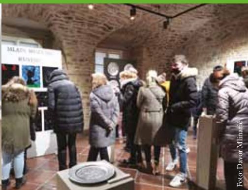
Odprtje razstave Mladi muzejski kustosi