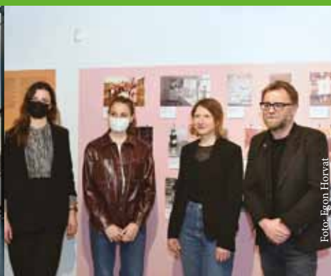
Pri razstavi (P)ostati ženska smo k sodelovanju povabili Center sodobnih umetnosti.