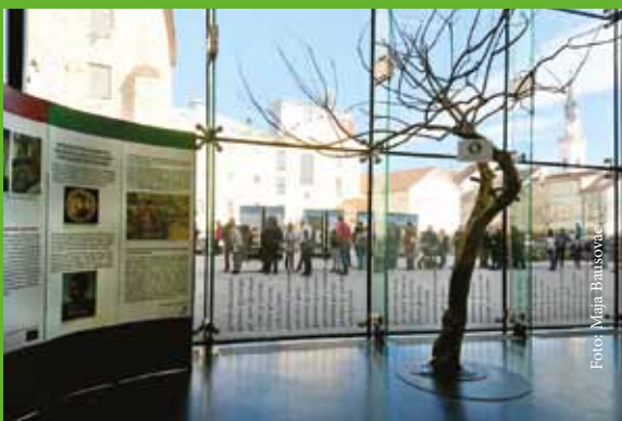
Prešernovanje 2022 – sprostitve ukrepov je privabila številne obiskovalce v Pokrajinski muzej Celje.