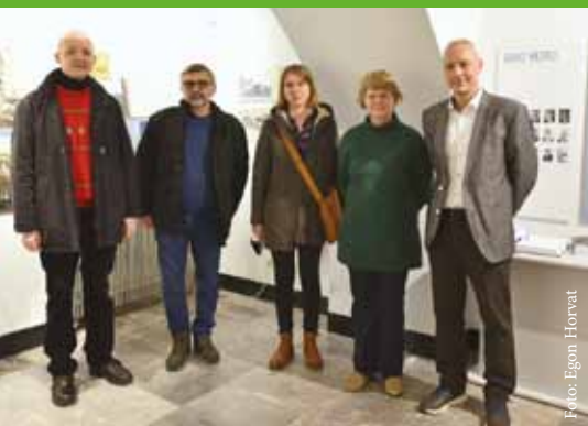
Za razstavo Lepo mesto so moči združili zaposleni iz več celjskih kulturnih ustanov.