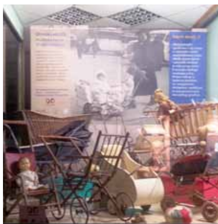
Otroški vozički v bivšem Borovem.