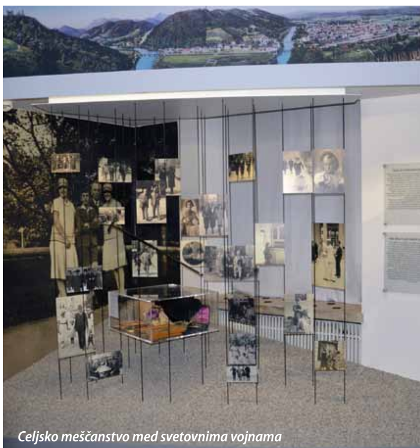
Celjsko meščanstvo med svetovnima vojnama

Muzej novejše zgodovine Celje vas vabi na ogled prenovljene stalne razstave Živeti v Celju. Razstava o mestu Celju in njegovih prebivalcih v 20. stoletju.