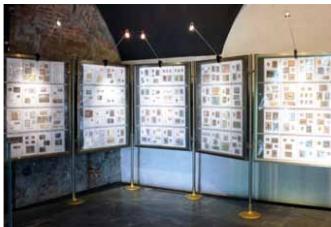
Razstava znamk Pozabi oteta preteklost.

S celjskimi filatelisti načrtujemo v prihodnje še več skupnih predstavitev in razstav, hkrati pa vabljeni vsi, ki vas filatelija zanima, da se pridružite našim projektom in nam s svojim znanjem in izkušnjami pomagata bogatiti celjsko filatelistično dediščino. DAMIR ŽERIČ