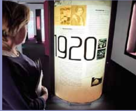
Fototeba Muzeja novejšje zgodovine Slovenije