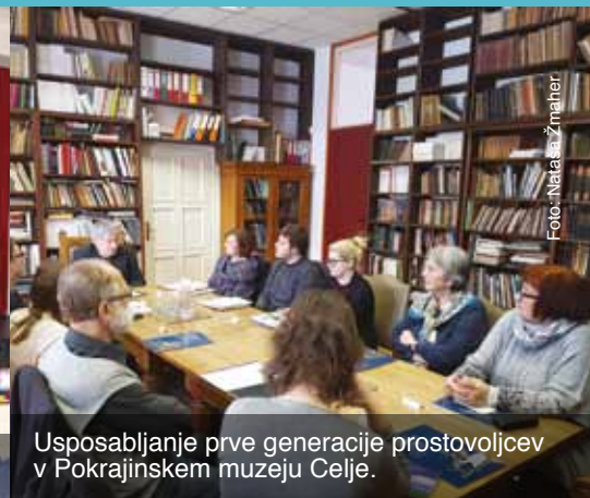
Usposabljanje prve generacije prostovoljcev v Pokrajinskem muzeju Celje.