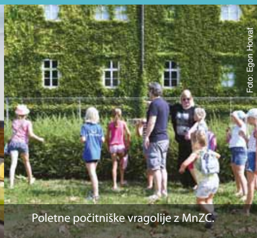
Poletne počitniške vragolije z MnZC.