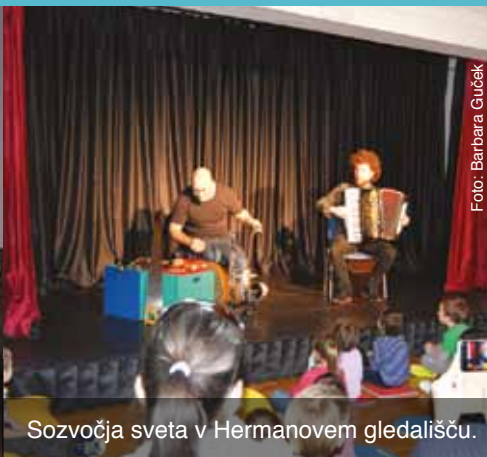
Sozvočja sveta v Hermanovem gledališču.