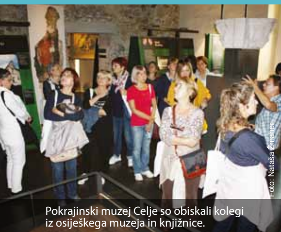
Pokrajinski muzej Celje so obiskali kolegi iz osiješkega muzeja in knjižnice.