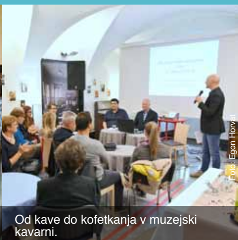
Od kave do kofetkanja v muzejski kavarni.