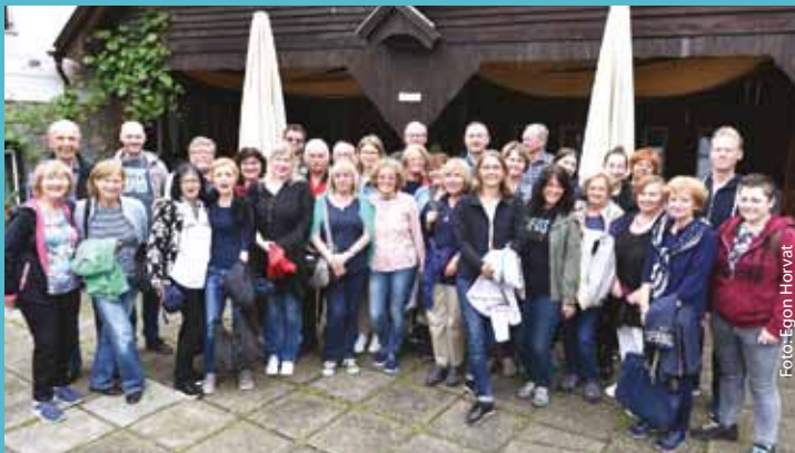
Sodelavci in prostovoljci MnZC na strokovni ekurziji v Lendavi.