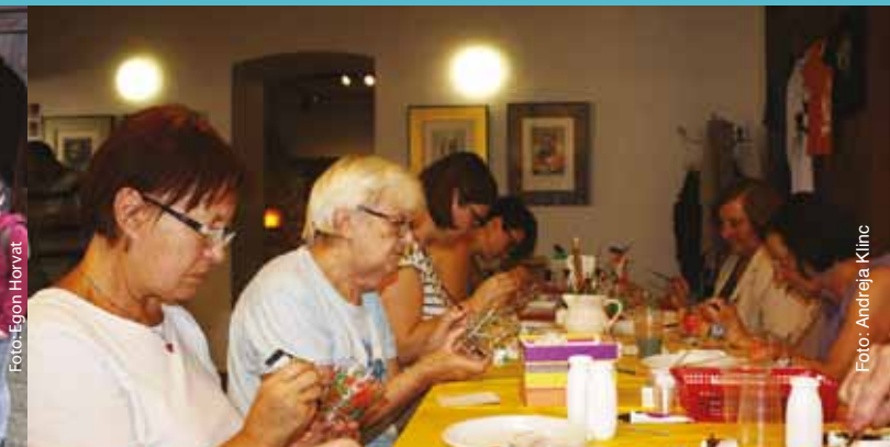
Ogled razstave Steklo na Celjskem je udeležencem delavnice ponudila sveže ideje za poslikavo lastnih izdelkov.