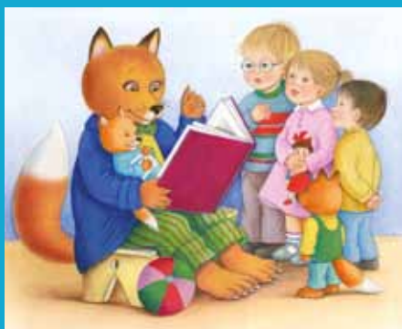
Ilustracija: Jelka Reščman